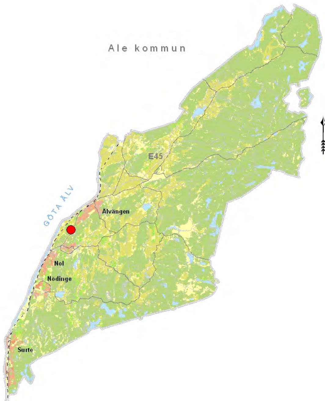
Figur2. Karta som visar Ale kommun med platsen för utredningen markerad med rött.