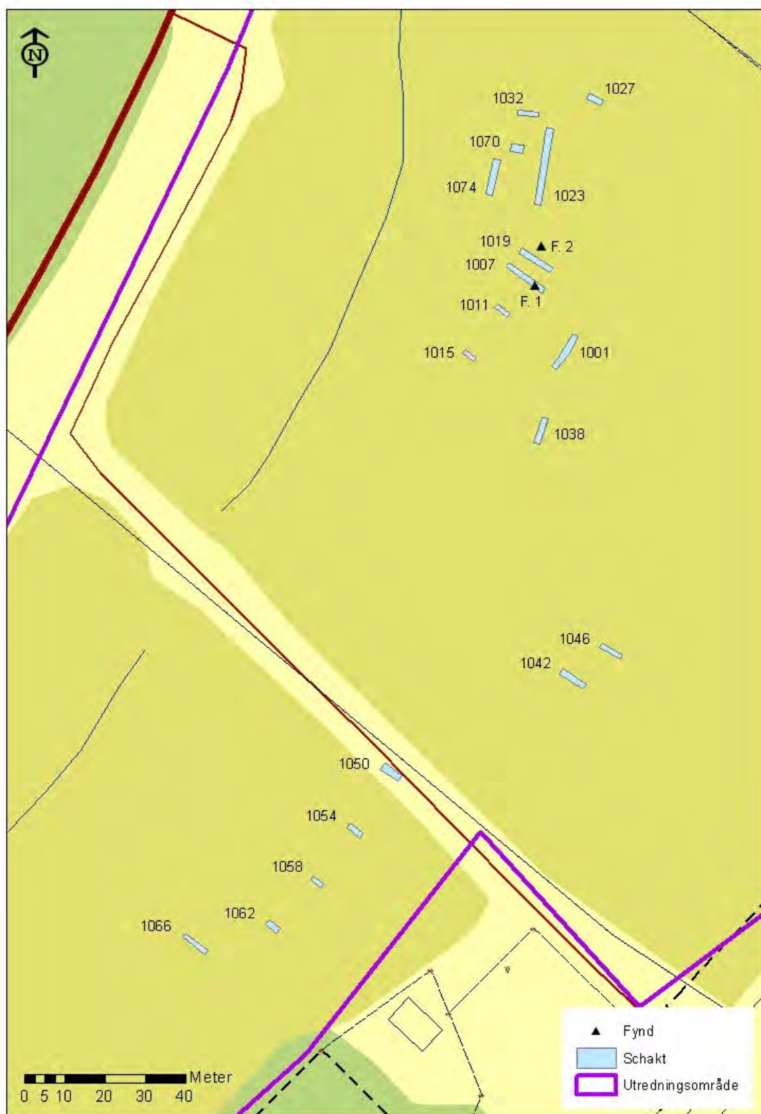
Figur 4. Schaktplan. Utsnitt ur Digitala Fastighetskartan, skala 1:1 000.