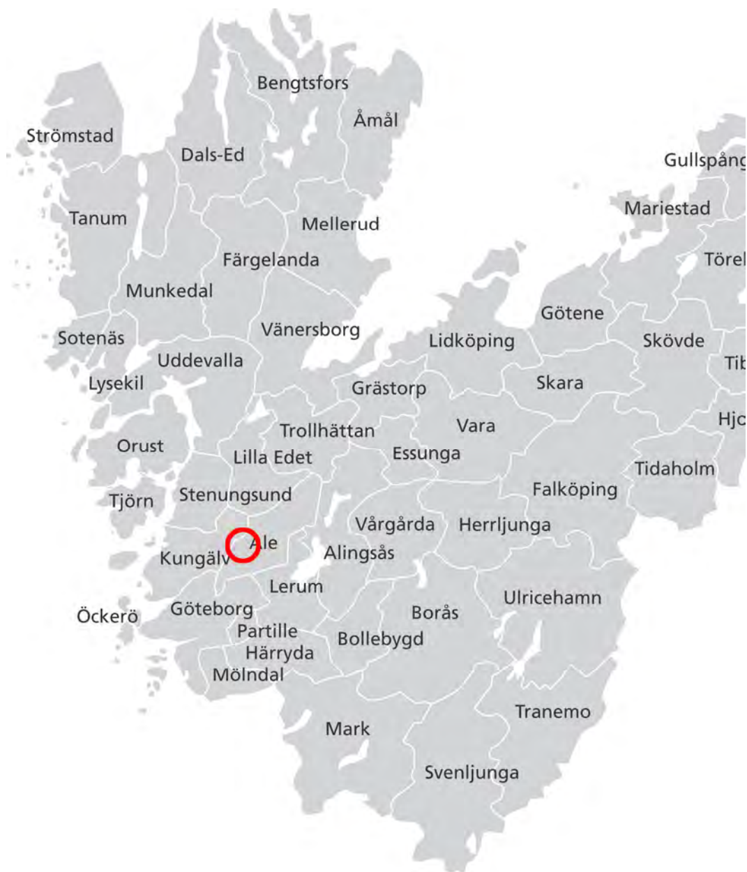
Figur 1. Karta över Västra Götalands län med platsen för utredningen markerad med röd ring.