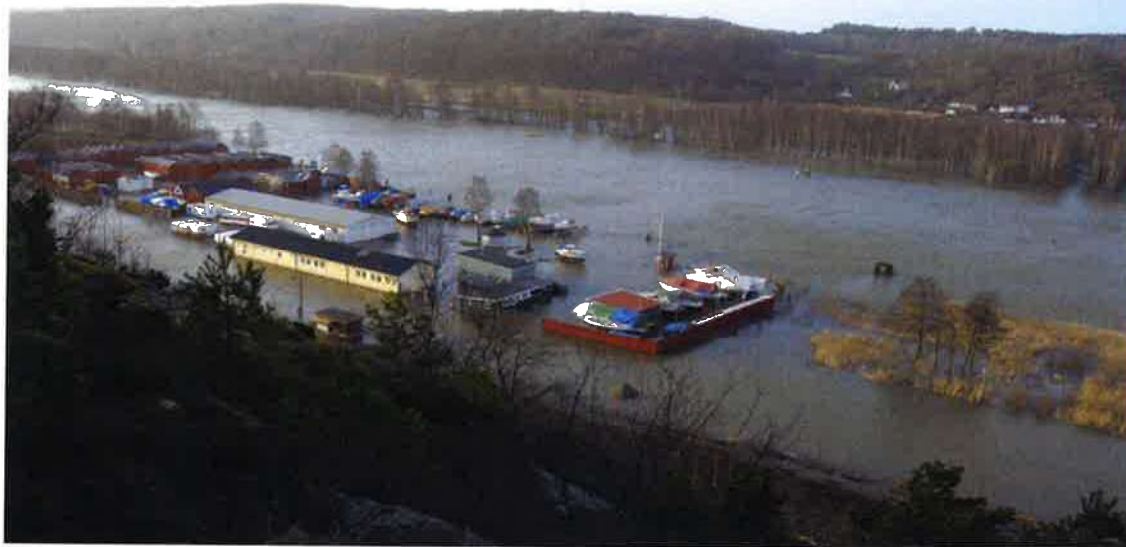
Surte gamla båthamn

*Recipient = mottagare d.v.s. i detta fall vattendrag