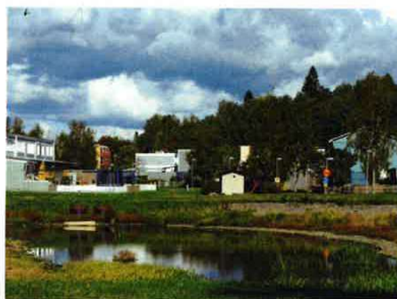
Födröjningsdamm i Röda dalen, Nol.

Dagvatten berör flera av de 16 nationella miljömålen, i första hand: Myllrande våtmarker, Levande sjöar och vattendrag, Grundvatten av god kvalitet, Ingen övergödning, Giftfri miljö och God bebyggd miljö.