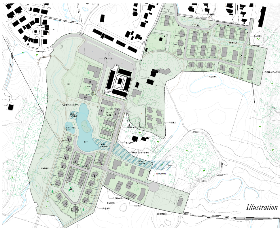
Illustration till detaljplanen