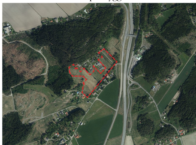
Planområdets läge och ungefärliga avgränsning.

En detaljplan innehåller bestämmelser om hur marken får bebyggas och vad den ska användas till. Detaljplanen är en juridiskt bindande handling och styrs av Plan- och bygglagen (PBL). Allmänna intressen vägs mot enskilda för att nå en god helhetslösning och planen ligger sedan till grund för beslut om till exempel bygglov.