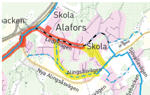
Röd sträckning visar primära och gul sträckning sekundära skolvägar i "Trafikplan Ale, 2011"

Skolorna och serviceboendet i området ställer höga krav på trafiksäkerhet för oskyddade trafikanter. Delen av Ledetvägen som går från Ahlafors skolan till Himlaskolan mot E45, är också utpekad som primär skolväg i kommunens trafikplan. Gång- och cykelvägarna är av varierande standard längs med vägen och framkomligheten för cykel är bristfällig då nätet främst är utformat för gångtrafikanter. Ledetvägen ska hålla god standard för gång- och cykeltrafik och möjliggöra för dessa trafikslag att effektivt ta sig igenom Alafors tätort. För detta krävs kompletteringar i gång- och cykelnätet.