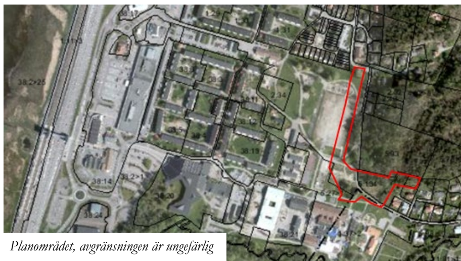
Planområdet, avgränsningen är ungefärlig

En detaljplan innehåller bestämmelser om hur marken får bebyggas och vad den ska användas till. Detaljplanen är en juridiskt bindande handling och styrs av Plan- och bygglagen (PBL). Allmänna intressen vägs mot enskilda för att nå en god helhetslösning och planen ligger sedan till grund för beslut om till exempel bygglov.