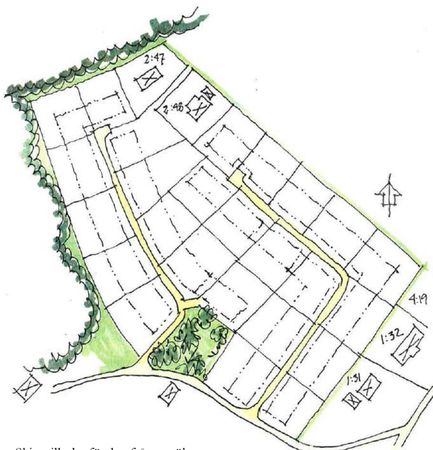
Skiss till planförslag från ansökan