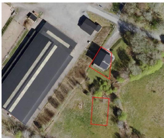
Figur 1 Planytornas läge och ungefärliga avgränsning. Röda linjer är ändringsytor.

Planområdet ligger väster om Vimmersjön i Nödinge. Området som berörs av planändringen är cirka 500 kvadratmeter och består av två ytor inom fastigheten Nödinge 4:292. Marken är privatägd.