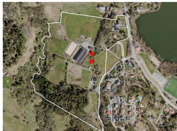
Figur 2 Planytornas läge och ungefärliga avgränsning. Röda markeringar är ändringsytor. Vit linje är planområdesgräns för originalplan.

En ändring av en detaljplan kan användas för att anpassa planen till nya förhållanden och hålla den aktuell utan att genomföra hela den lämplighetsbedömning som görs vid upprättandet av en ny plan.