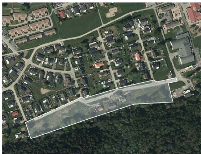
Planområdets läge och ungefärliga avgränsning.