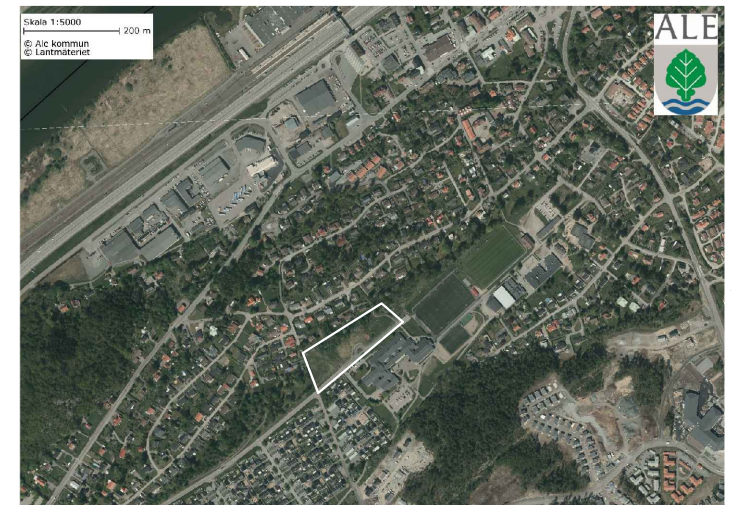
Planområdets lokalisering i Älvängen