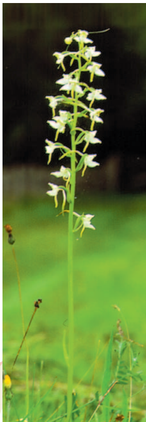
Grönvit nattviol (PD)

Längre fram till vänster om stigen skimtar en låg ås bevuxen med granar.