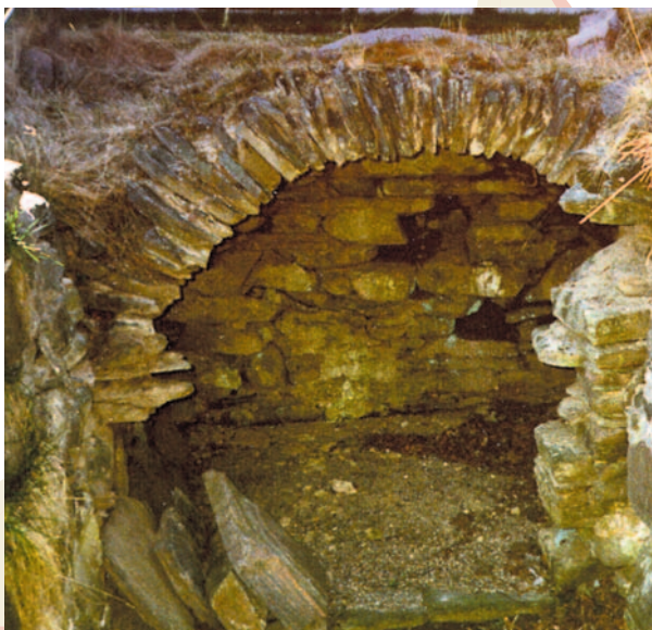
Källarvalv från lilla Alfhem (GM)

5. Vid hålvägen vinklar vår väg åt vänster och strax är vi vid en ” fruktträdgård ”. Den består av en samling vildäppleträd som i maj månad står i blom och skänker väldoft. Mängden av fruktträd skvallrar om att här kan ha legat ett torp eller liknande bostad, vars grund dock är svår att upptäcka idag. Nu vinklar stigen åt höger och förenas småningom med grusvägen som leder till gårdsplatsen Lilla Alfhem .