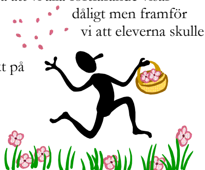
Bilden föreställer en glad elev på Kyrkbyskolan.

Tidsschemat för projektet ser ut så är: Tisdag v 45: Lagen informeras mer om projektet