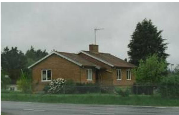
Utby 18:1 (Nytorp svägen 2) Liten villa med välbevarad 1950-talskaraktär. Huset har sadeltak, tegelfasader samt två husvolymer som är något förskjutna i förhållande till varandra.