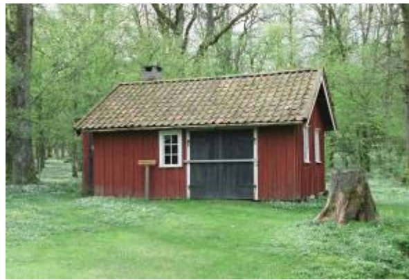
Smedjan. Gårdssmedja från Grolanda. Flyttad till Prästalund 1982.