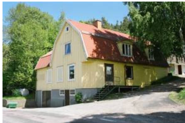
Blinneberg 1:25. F.d. affär

Falurött bostadshus från 1875 med timmerstomme, lock listpanel samt korspostfönster. Ursprung?