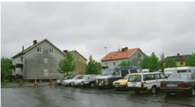
Utby 3:100. Fyra hyreshus med olikfärgade eternitfasader. Husen har sadeltak samt tvåluftsfönster. Välbevarad 1940-talskaraktär trots vissa förändringar. Är eterniten ursprunglig?