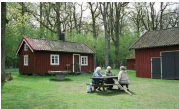
Topstugan. Låg ursprungligen på Grunnes utmark. Flyttad till Sandliden i början av 1800-talet och till Prästalund 1980.