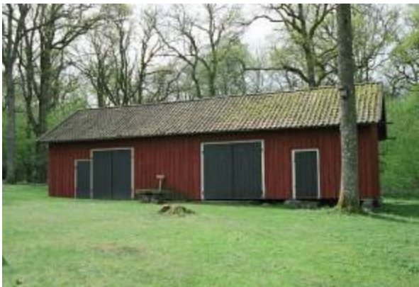
Ladugården. Kommer från Baskalyckan i Skalltorp. Flyttad till Sandliden i början av 1880-talet och till Prästalund 1978.