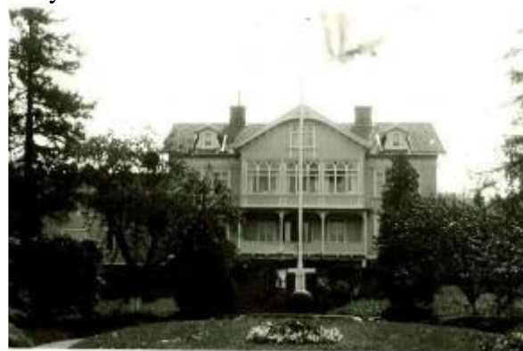
Stora Viken.

En av de viktigaste gårdarna i Nödinge socken. Stor timrad manbyggnad i två våningar med panel som ursprungligen innehöll många snickeridetaljer. Intill ligger en kvarnbyggnad med putsade fasader. I trädgården finns rester efter tegelbruk och trädgårdsmästeri. Under 1900-talets andra hälft har anläggningen utnyttjats för industriella ändamål (Vasoverken, Ledu m.fl.) och denna bebyggelse dominerar idag intrycket.