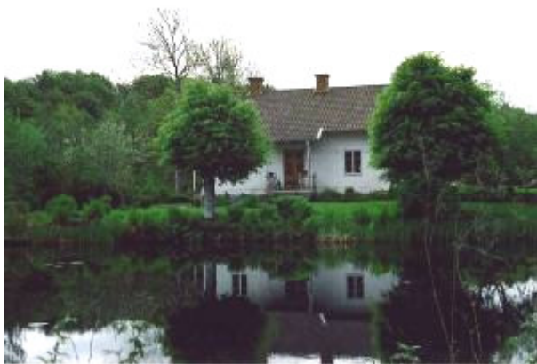
Kilanda 5:10. F.d. mjölnarbostad

Mycket välbevarad skolbyggnad uppförd omkring 1865 (1882?) i sten. Den timrade byggnaden har ett påkostat utseende med reveterade fasader, spröjsade fönsterpartier, mönstermurning samt skolklocka på gaveln. Skolan innehöll från början två skolsalar samt lärarbostad. Byggnaden anknyter med sin form till andra byggnader kring säteriet.