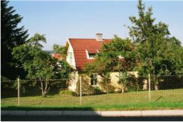
Utby 3:94 (Hörnet Bankbacken /Hövägen) Egnahem med mansardtak, träpanel samt korspostfönster. Välbevarad 1920-30-talskaraktär. Ligger i anslutning till två andra med samma karaktär.