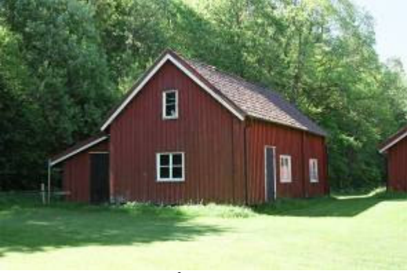
Kokhuset. Flyttat från Vadbacka gästgivargård 1960.