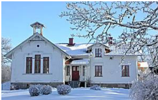
Kilanda 5:7. F.d. Kilanda skola.

Kvarnbyggnaden med tillhörande mjölnarbostad är ett viktigt inslag i kulturmiljön kring Kilanda säteri.