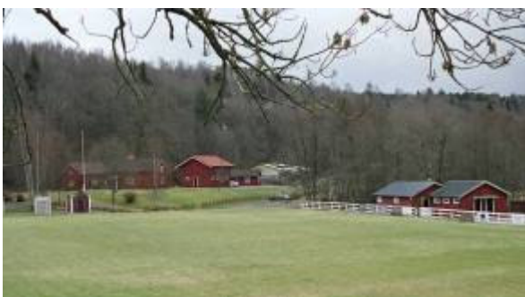
Vadbacka 2:29. Skepplanda hembygdsgård.

Kvarnbyggnad med hög stengrund samt överbyggnad i trä. Välbevarad karaktär. En av två bevarade kvarnar utmed Forsåns fall. Stort värde ihop med den nedre kvarnen.