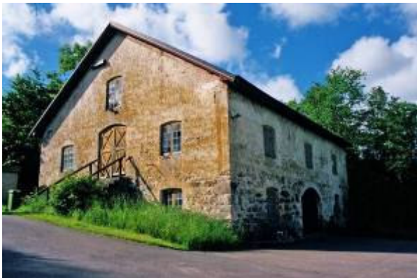
Vadbacka 2:26. Fors nedre kvarn.

har dock under årens lopp genomgått flera förändringar. Förutom manbyggnaden fanns enligt en besiktning 1833 också hållstuga (där mat och öl serverades), köksbyggnad, hemlighus samt ladugård.