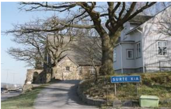
Gränne 1:4 Bostadshus

Kyrkan i Surte uppfördes 1912 på en tomt skänkt av Surte glasbruk. Den ritades av den namnkunnige arkitekten Sigfrid Ericson. Platsen var väl vald, alldeles vid landsvägen, mitt emot järnvägsstationen. Kyrkan är enskeppig med ett vapenhus på södra sidan och torn i öster. Dess särskilda kännetecken är fasaderna med naturligt rundslipade stenar frilagda i fasadputs och socklar. Stenen kommer från Skårdalsböndernas stenmurar. Taket täcks av skiffer. Interiören präglas av stor omsorg om helhetsintryck och originella detaljlösningar. Efter sekelskiftet 1900 gör sig mer nationalromantiska strömningar gällande. Kyrkorna från denna tid präglas av ett skickligt utnyttjande av naturmaterial och ett traditionellt formspråk i kombination med stilideal som lånades från när och fjärran. Kyrkan i Surte är ett av länets bästa exempel från denna tid. Kyrkan är skyddad enligt 4 kap. KML.