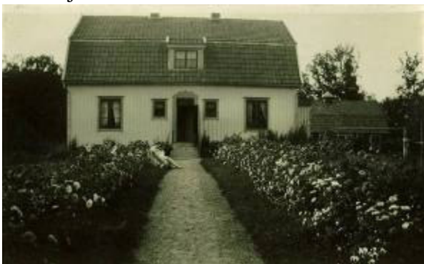
Äldre bild av lärarbostaden.

Sålanda 2:14 och 2:15. F.d. Sålanda skola F.d. skola med lärarbostad. Skolhus från 1924 med mansardtak, träpanel samt stora korspostfönster med spröjs i nedre lufterna. Välbevarad karaktär trots vissa förändringar. Innehöll från början skolsal, slöjdsal, gymnastiklokal, tambur, kapp- och duschrum samt en bostad om 1 rok. Intill ligger lärarbostad från 1924. Huset har genomgått förändringar men har ett miljövärde tillsammans med skolan. Karaktäristisk skolmiljö.