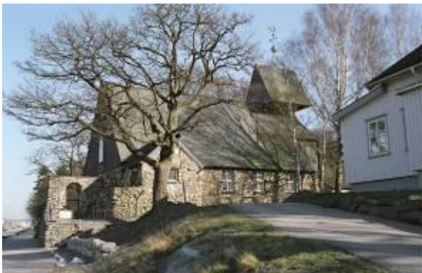
Gränne 1:4 Surte kyrka med församlingshem.

Kyrkan i Surte uppfördes 1912 på en tomt skänkt av Surte glasbruk. Den ritades av den namnkunnige arkitekten Sigfrid Ericson. Platsen var väl vald, alldeles vid landsvägen, mitt emot järnvägsstationen. Kyrkan är enskeppig med ett vapenhus på södra sidan och torn i öster. Dess särskilda kännetecken är fasaderna med naturligt rundslipade stenar frilagda i fasadputs och socklar. Stenen kommer från Skårdalsböndernas stenmurar. Taket täcks av skiffer. Interiören präglas av stor omsorg om helhetsintryck och originella detaljlösningar. Efter sekelskiftet 1900 gör sig mer nationalromantiska strömningar gällande. Kyrkorna från denna tid präglas av ett skickligt utnyttjande av naturmaterial och ett traditionellt formspråk i kombination med stilideal som lånades från när och fjärran. Kyrkan i Surte är ett av länets bästa exempel från denna tid. Kyrkan är skyddad enligt 4 kap. KML.