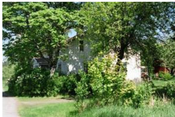
Färdsle 2:3. Bäckén

Färdsle omfattade fyra hela hemman 1550. Ett antal av gårdarna, varav två är välbevarade ligger kvar på den gamla bytomten.