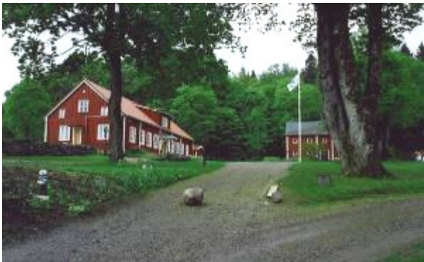
Alvhem 1:1, Kungsgården.

Alvhem har anor tillbaka till 1300-talet då byn Alweim omnämns som norsk förläning under en av kung Håkons tjänare. Vid 1500-talets mitt doneras sätesgården till Per Brahe och Visingsborgs grevskap för att sedan tillfalla riksråden Posse och Stiernsköld. På 1680-talet dras den in till kronan under Karl XI:s reduktion och tjänar sedan som bostad åt den första landshövdingen i Älvsborgs län.