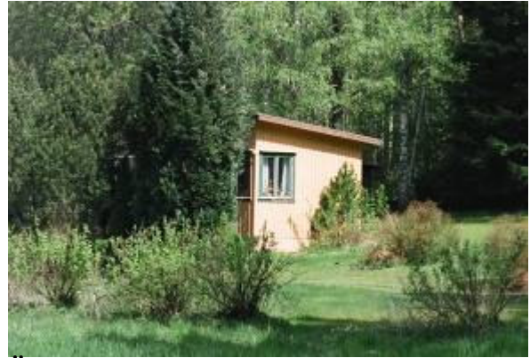
Älebräcke 1:24. Pytteliten sommarstuga på plintar. Funktionalistisk prägel med fönster över hörn. Representativ för 1940-50-talets sommarstugor som kunde vara mycket enkla.