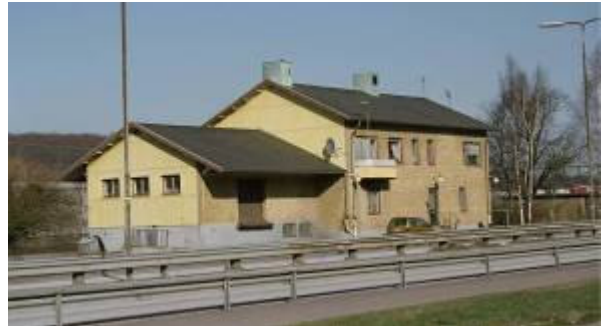
Surte 1:7 Järnvägsstationen.

Timrat bostadshus med det västsvenska dubbelhusets karaktär med panelkända fasader. Bevarad karaktär trots vissa förändringar. F.d. posten i Surte. F.d. prästgård?