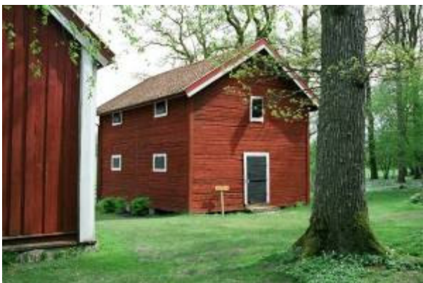
Magasinet. Spannmålsmagasin från Äskekärr. Flyttad till Prästalund 1972.