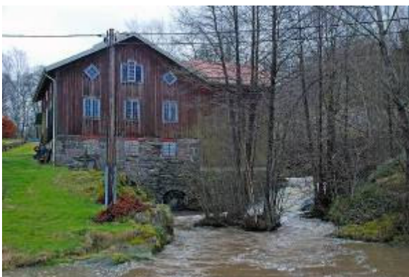
Fors 5:1/ Vadbacka 2:8. Fors övre kvarn

Kvarnbyggnad uppförd i början av 1800-talet i sten och tegel med putsade fasader. En av två bevarade kvarnbyggnader utmed Forsåns fall.