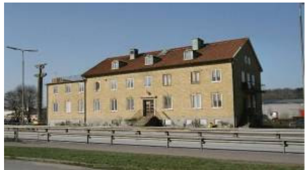
Surte 1:12 F.d. Brukskontoret.

Den nuvarande järnvägsstationen ersatt en äldre station i trä år 1939. Byggnaden har en tidstypisk utformning med gula tegelfasader och sadeltak med skiffer. På södra gaveln ligger en lägre godsmottagning. Bergslagernas järnväg drogs fram på 1870-talet och förstatligades 1947. Persontrafiken upphörde på 1960-talet. Viktig byggnad i Surtes historia som numera har tappat i betydelse och fått förfalla. Byggnaden skall rivas för att ge plats för breddad E45 och dubbelspår.