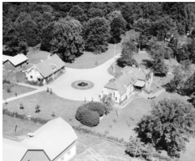
Kilanda 5:2. Kilanda säteri.

Mjölnarbostad som tidigare har tillhört säteriet. Byggnaden är uppförd i timmer omkring 1875 och har liksom skolan reveterade fasader med dekorativa detaljer samt sadeltak med stora takutsprång. Byggnaden ligger mycket vackert vid kvarndammen.